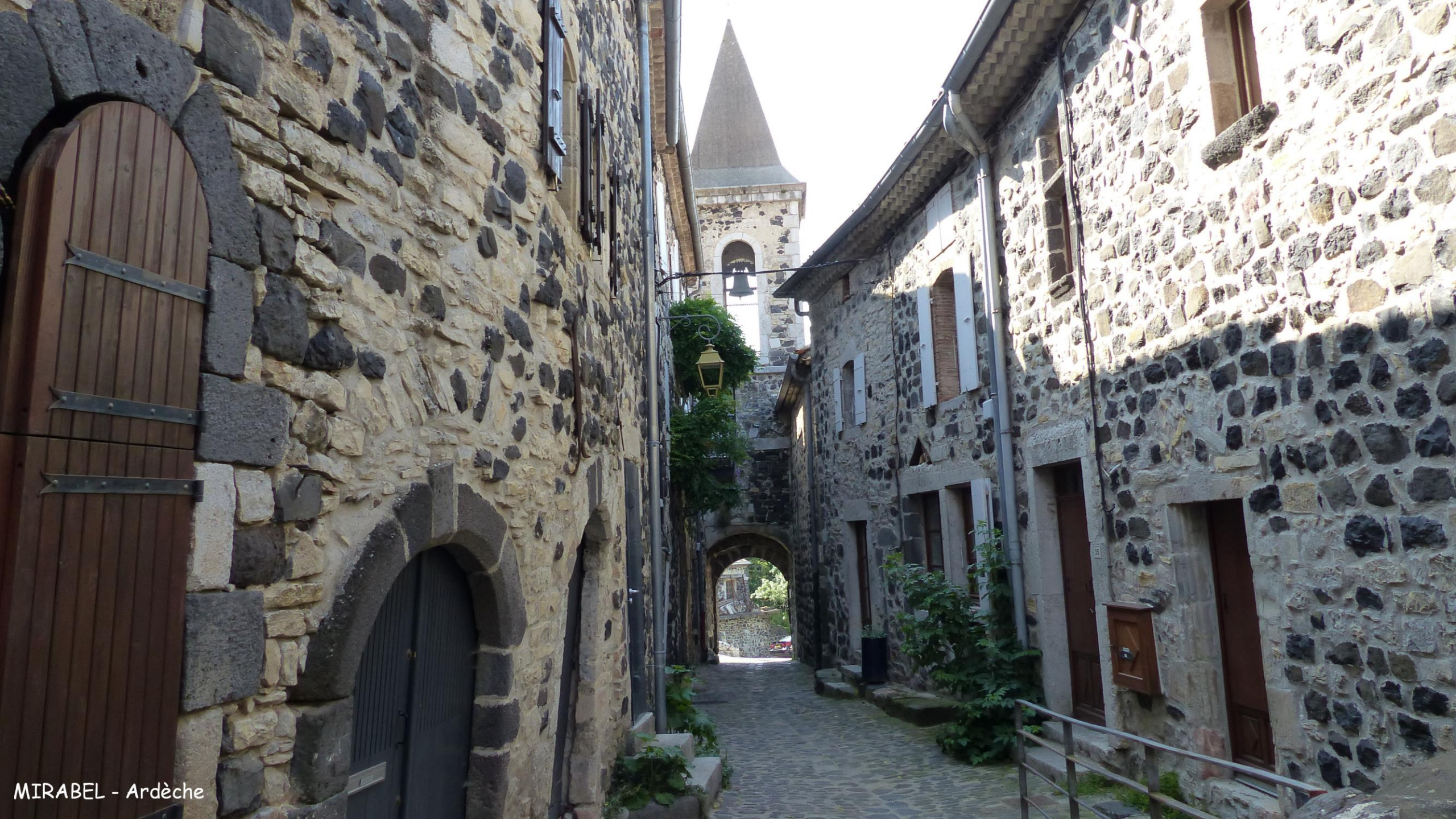
MIRABEL - Ardèche