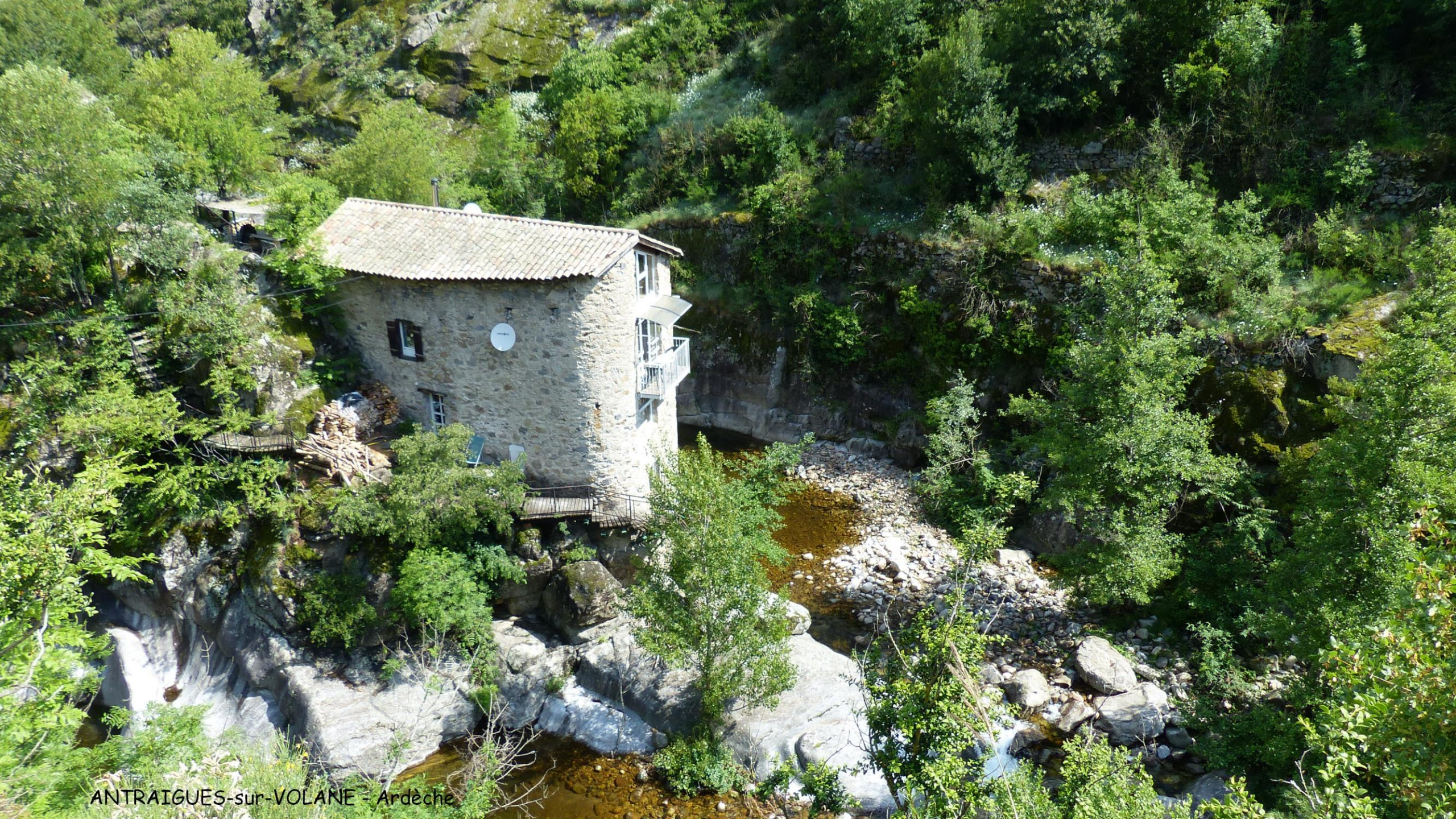
ANTRAIQUES-sur-VOLANE - Ardèche