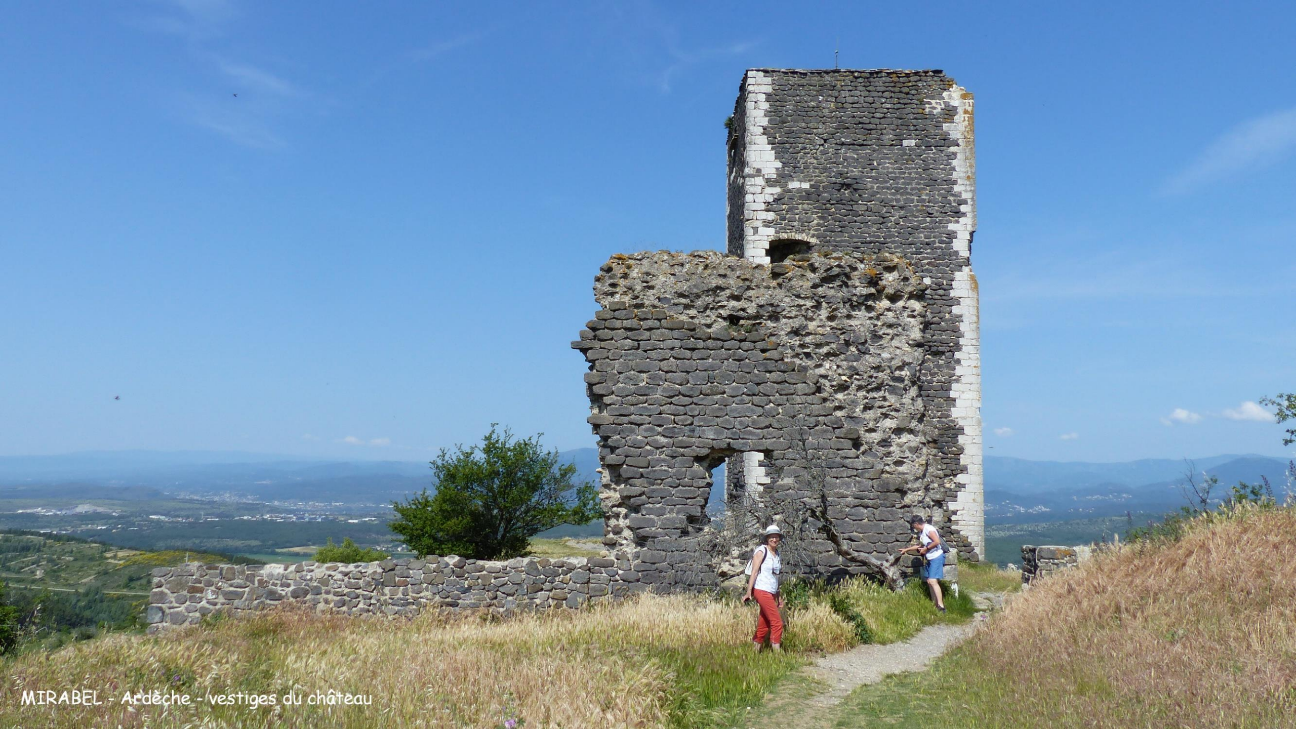
MIRABEL - Ardèche - vestiges du château