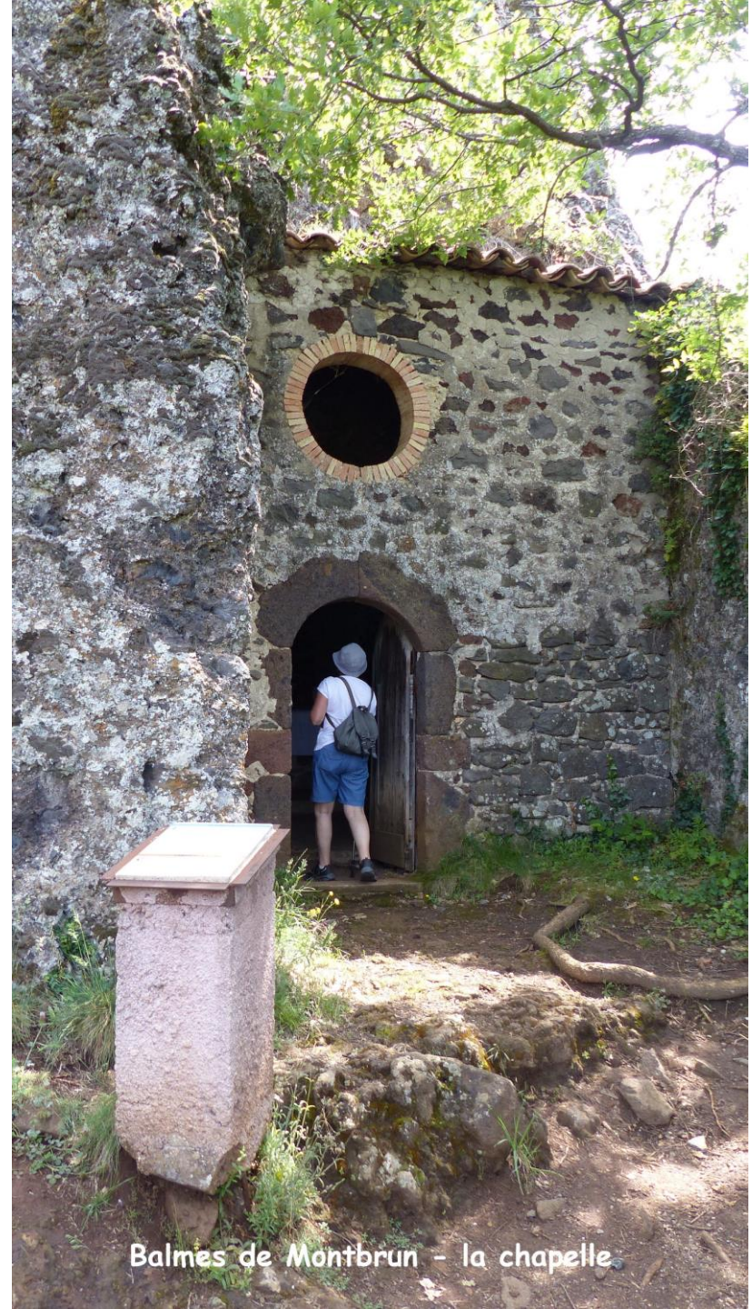
Balms de Montbrun - la chapelle