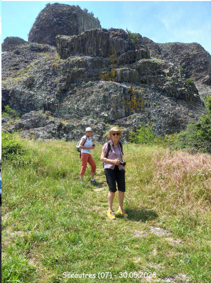
Sceautres (07) - 30.05.2023