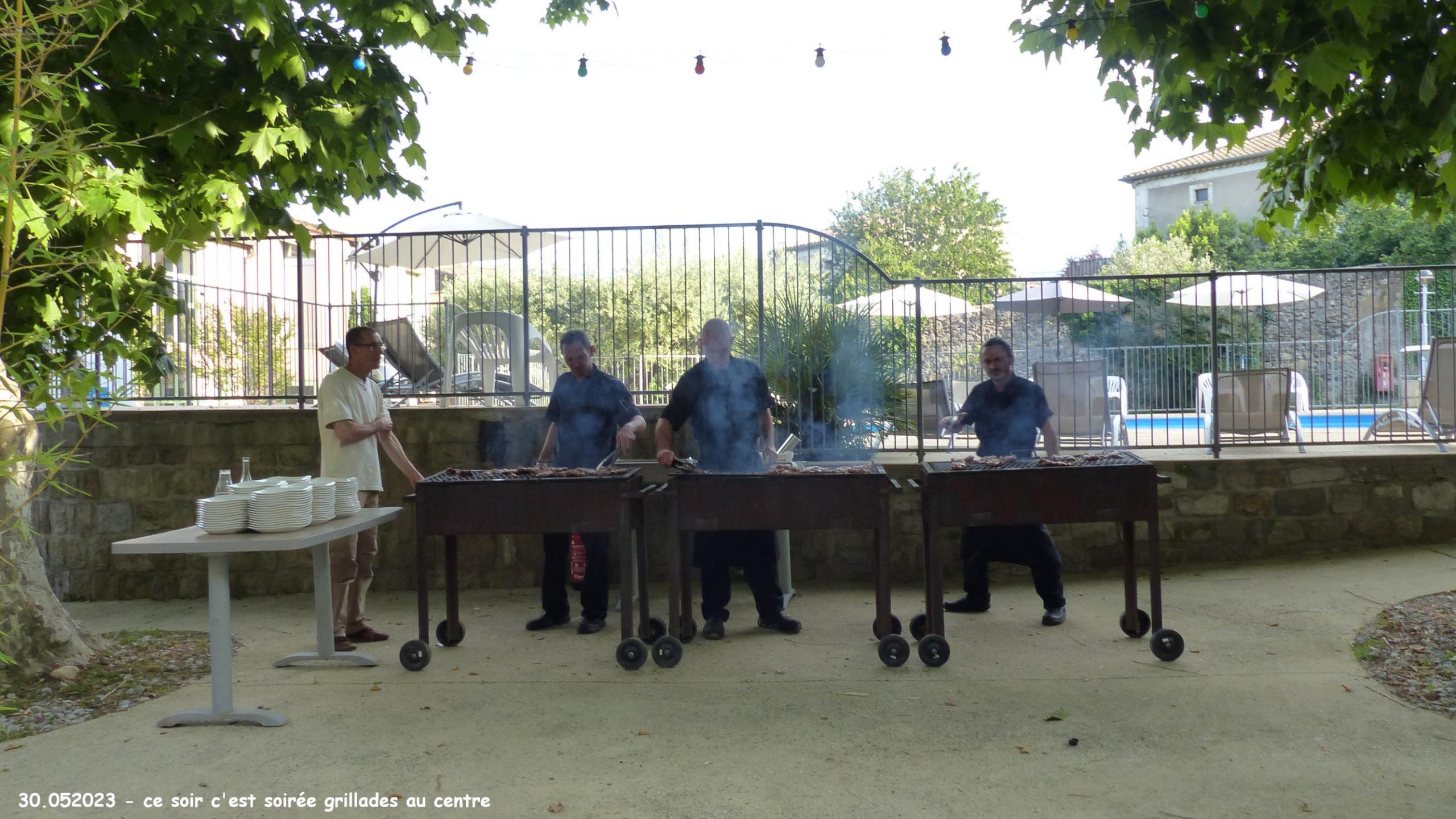
30.052023 - ce soir c'est soirée grillades au centre