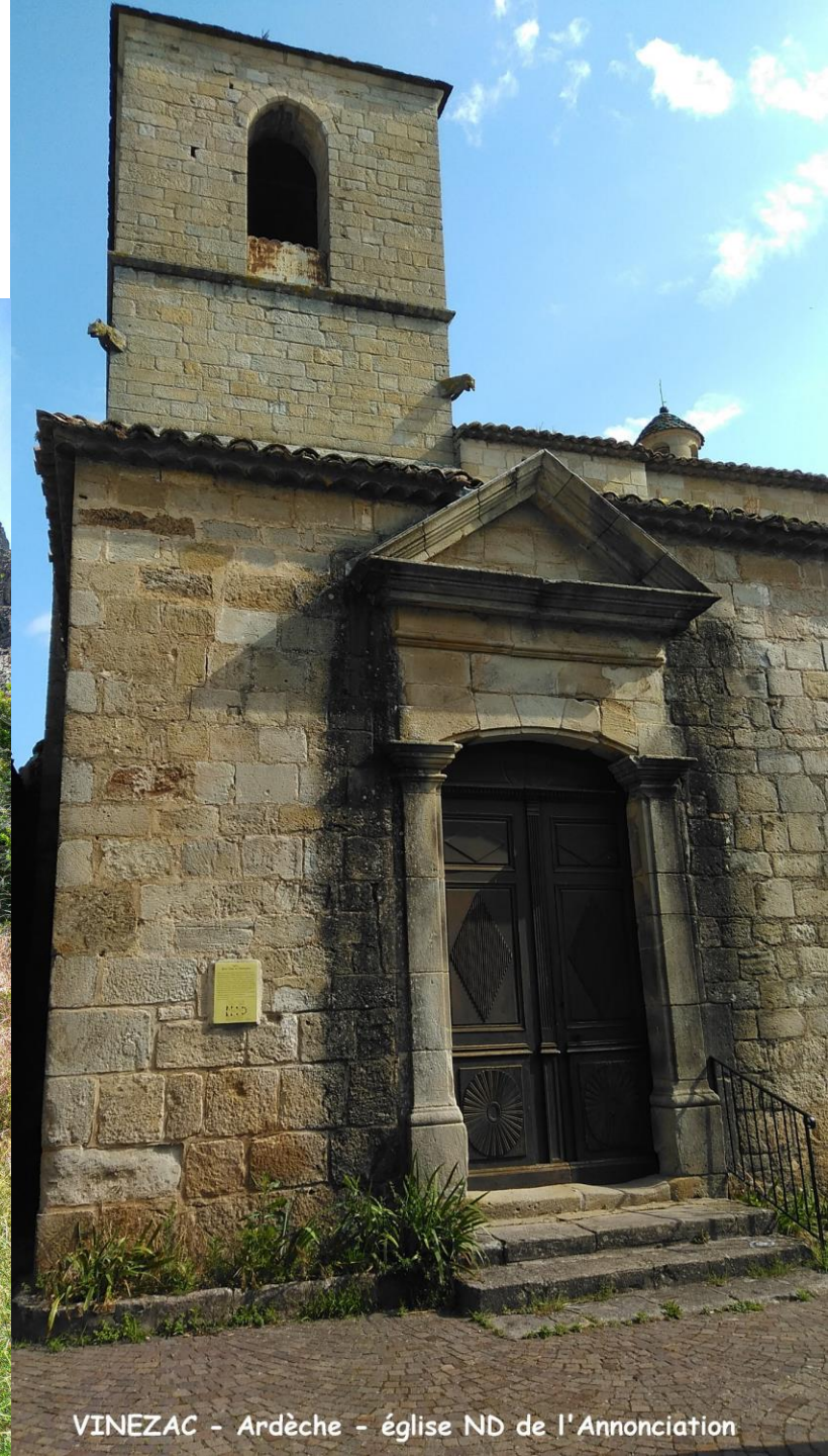
VINEZAC - Ardèche - église ND de l'Annonciation