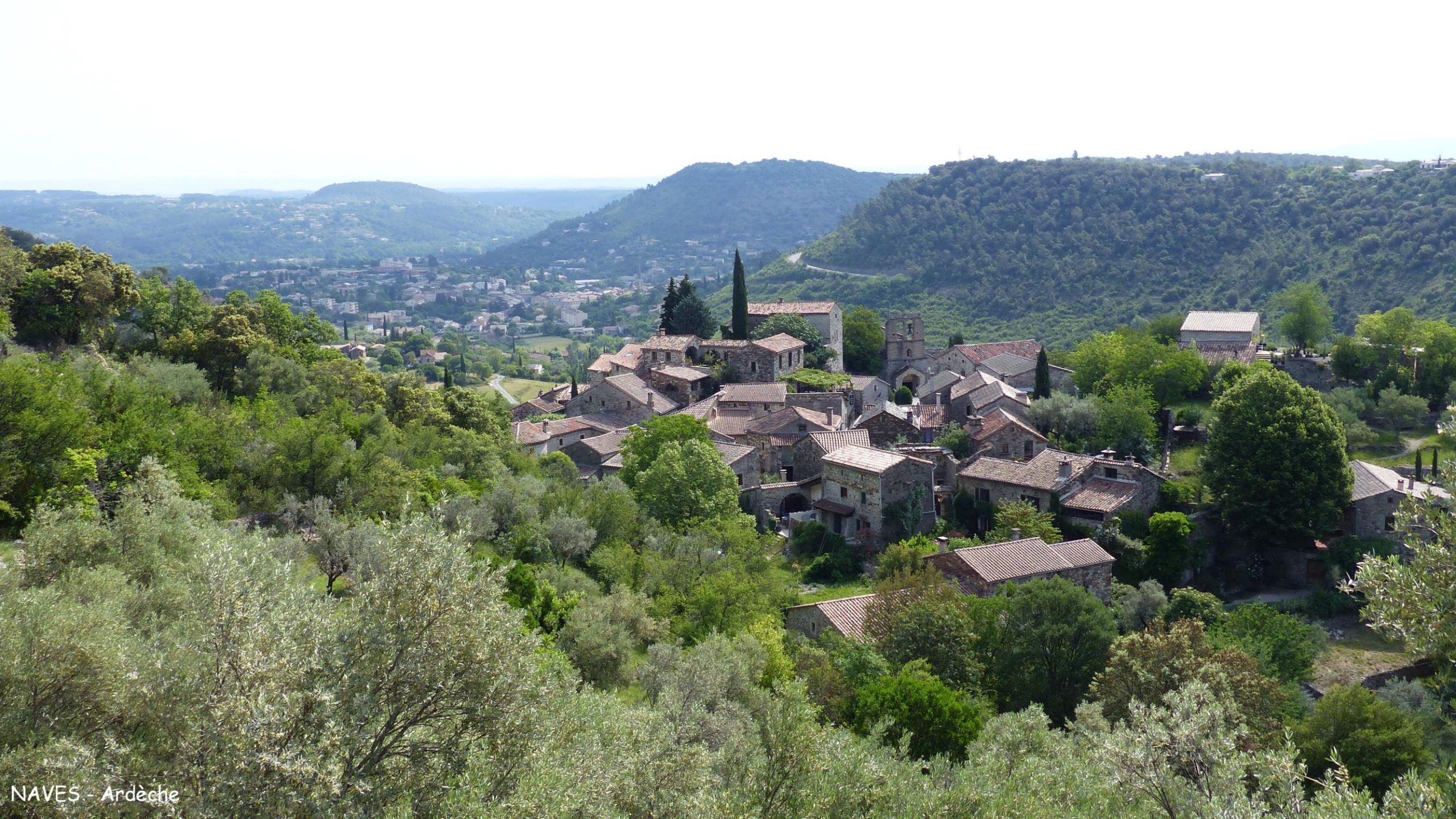
NAVES - Ardèche