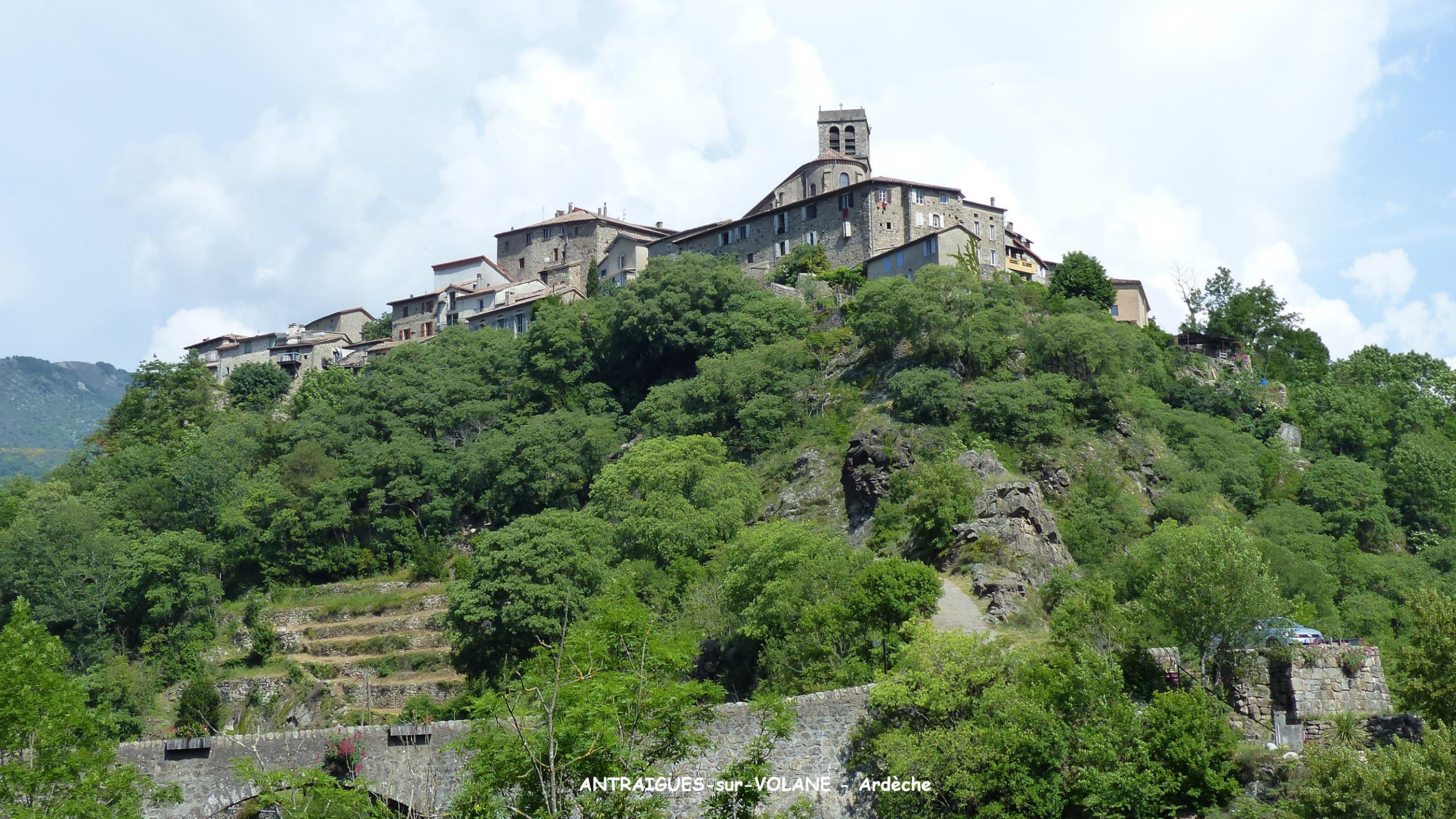
ANTRAIQUES-sur-VOLANE - Ardèche