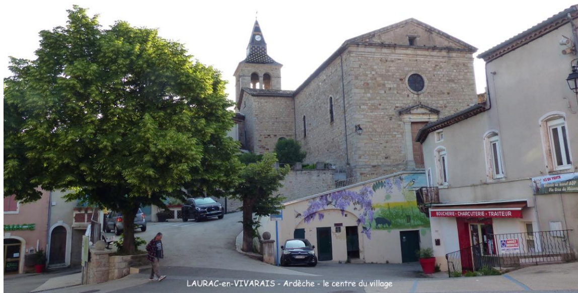
LAURAC-en-VIVARAIS - Ardèche - le centre du village