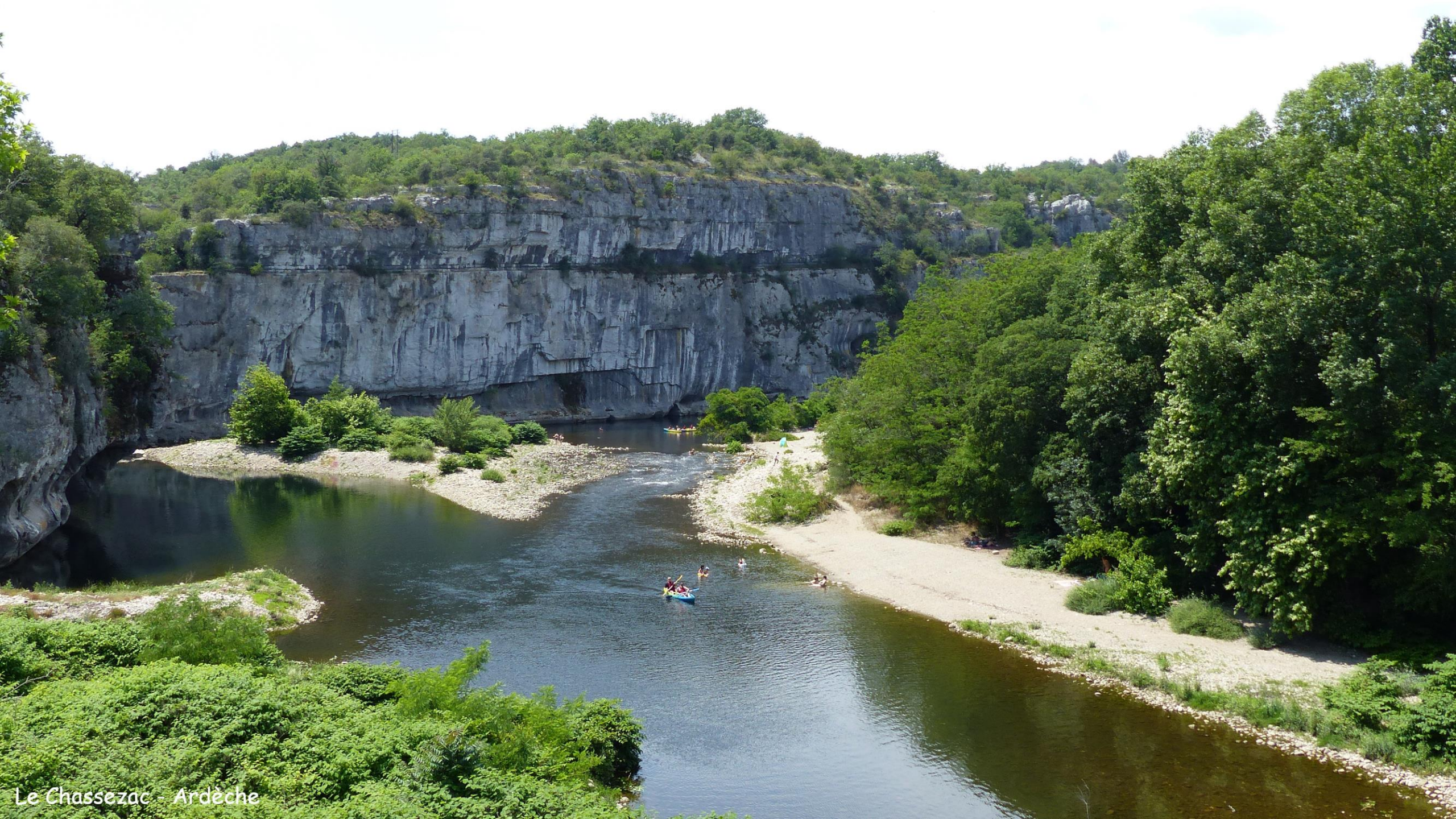
Le Chassezac - Ardèche