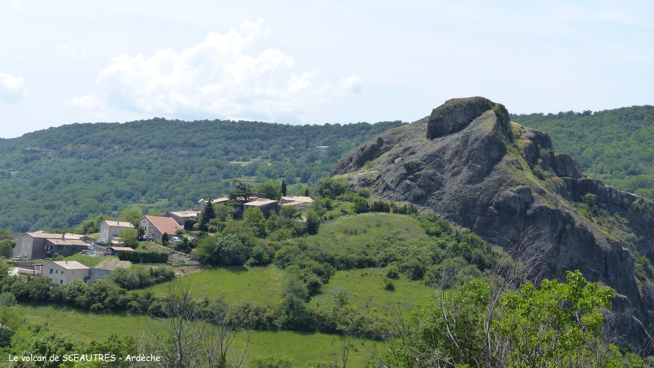
Le volcan de SCEAUTRES - Ardèche