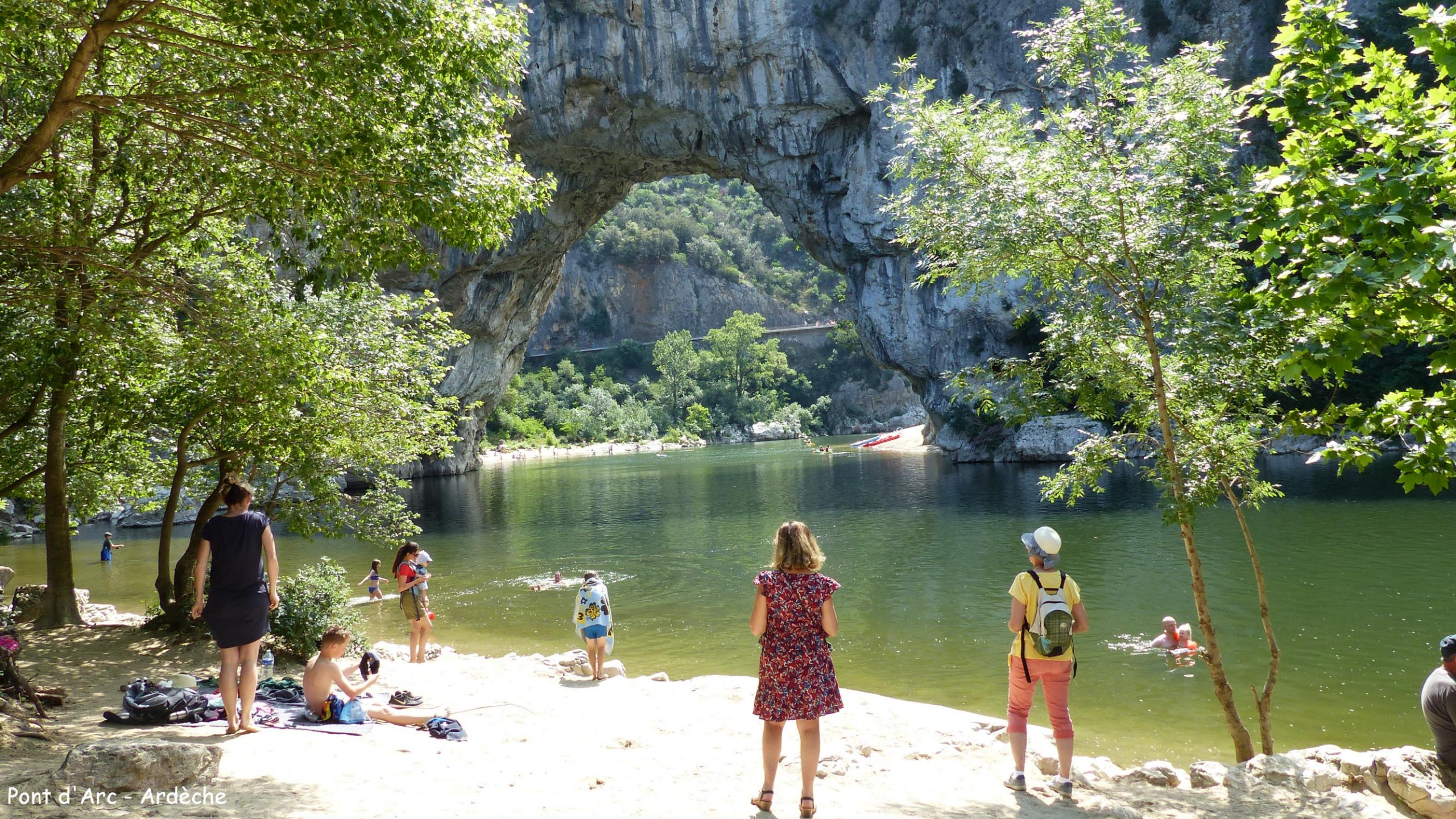
Pont d'Arc - Ardèche