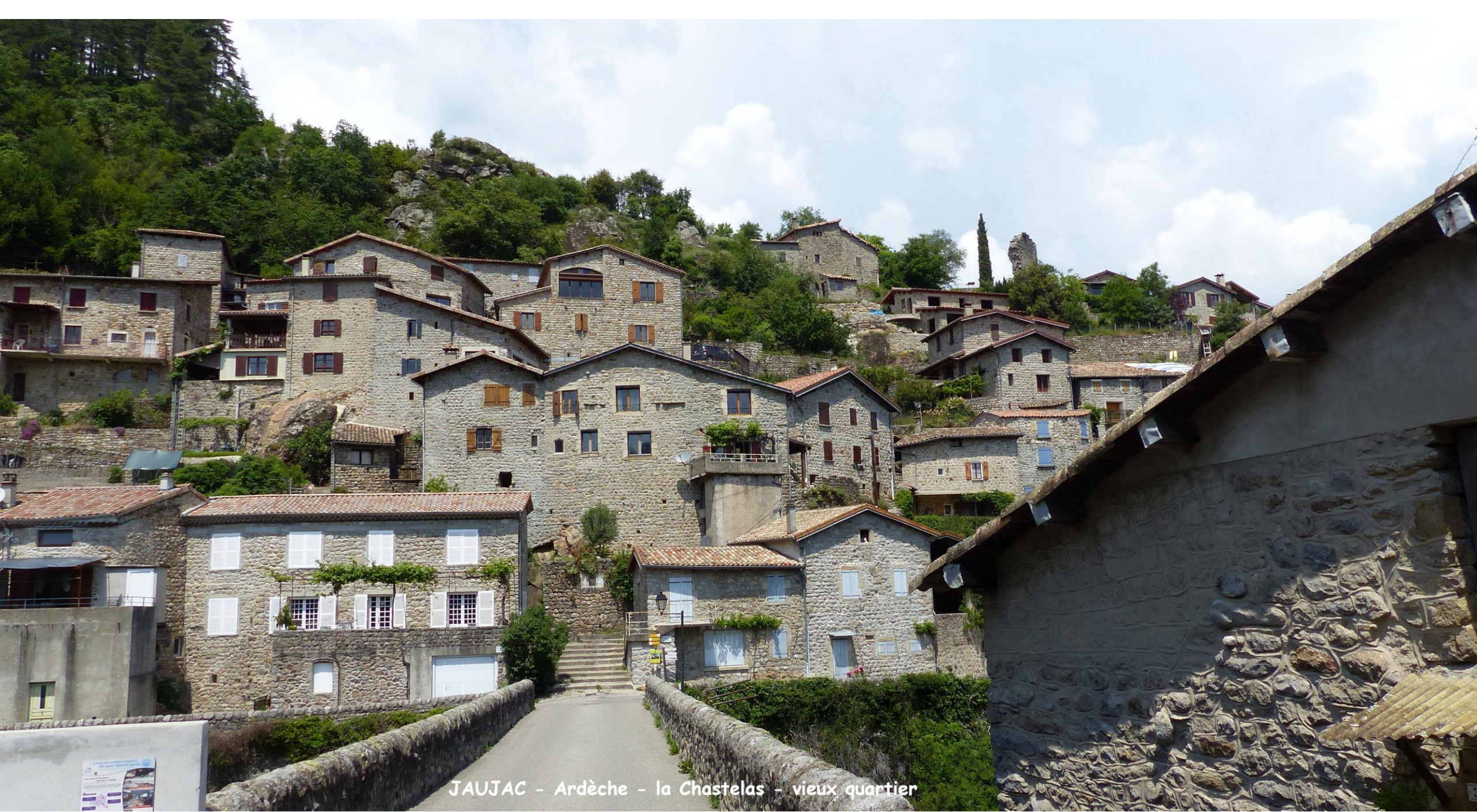
JAUJAC - Ardèche - la Chastelas - vieux quartier