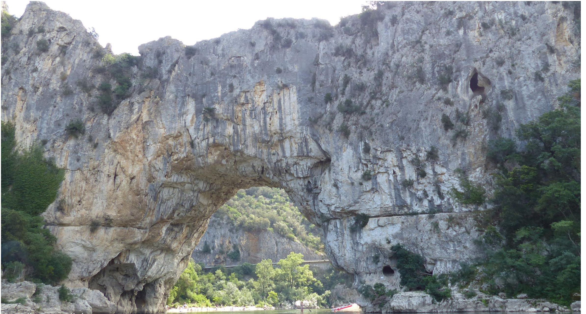
Pont d'Arc - Ardèche