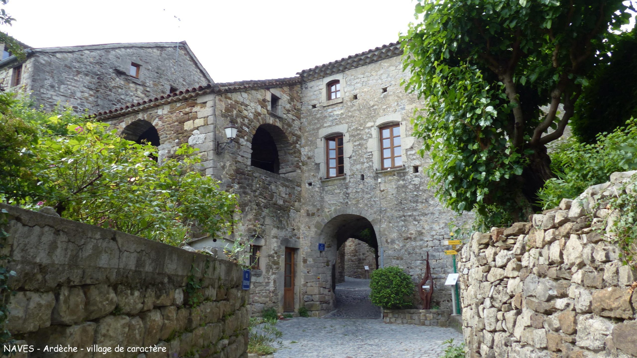
NAVES - Ardèche - village de caractère