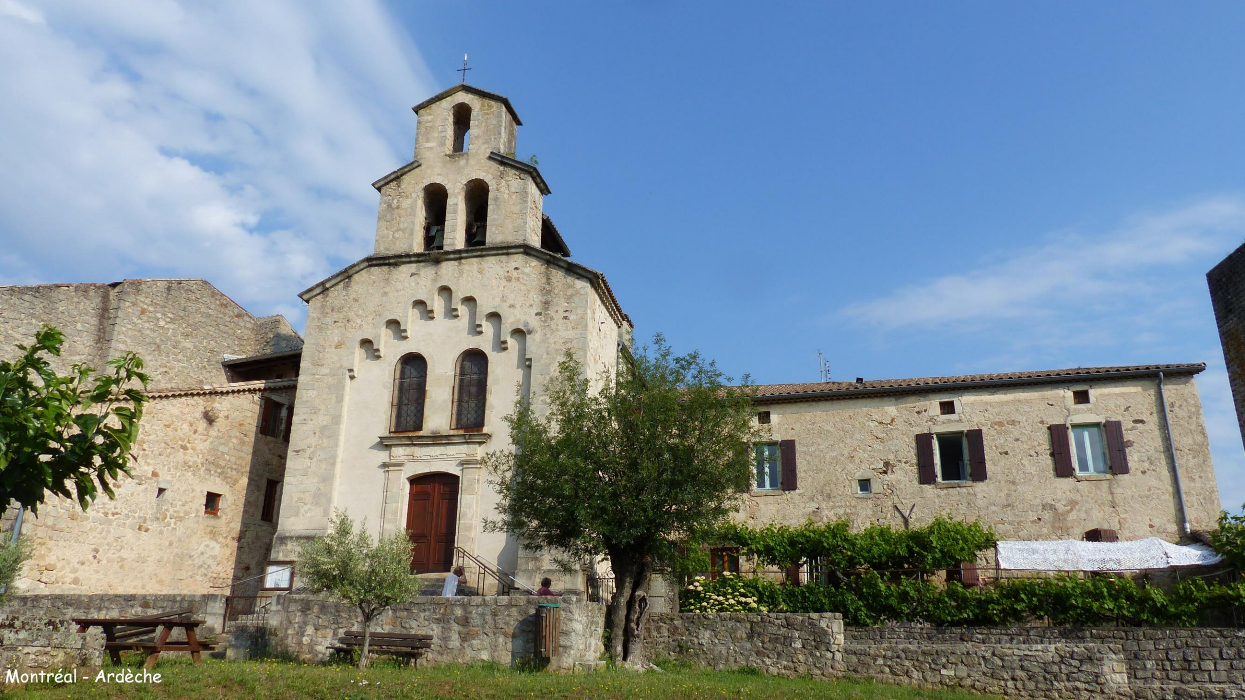
Montréal - Ardèche