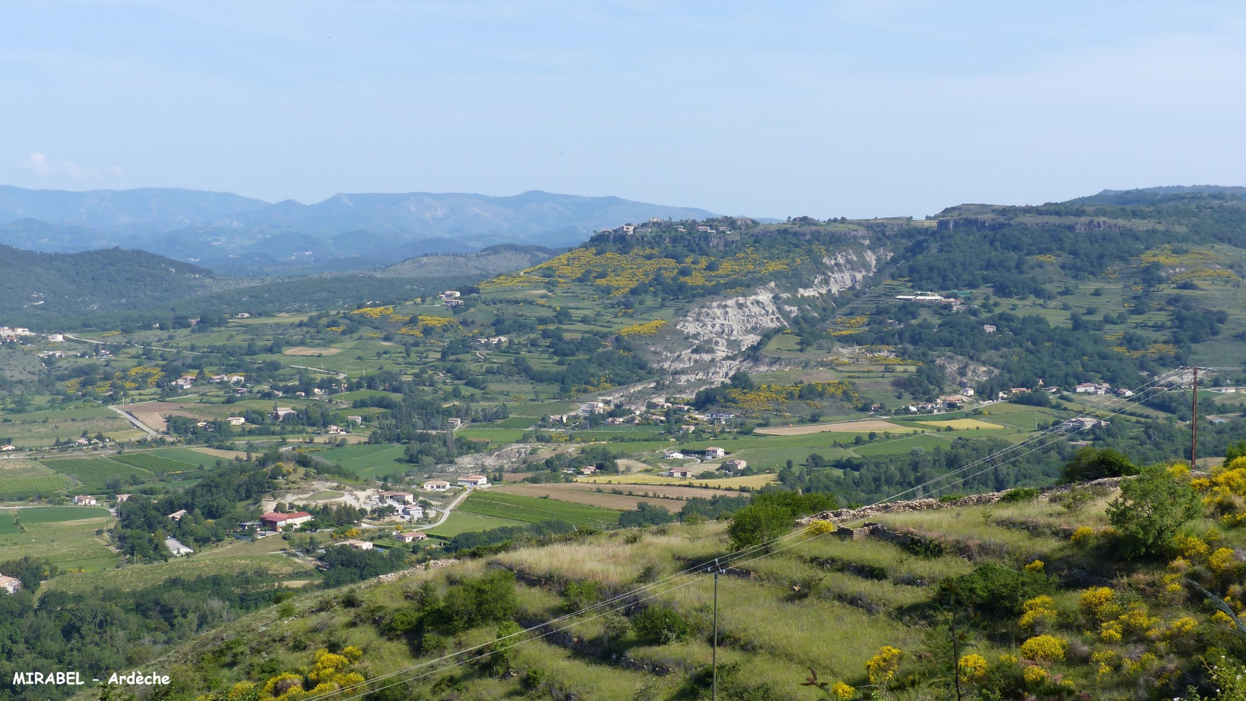
MIRABEL - Ardèche