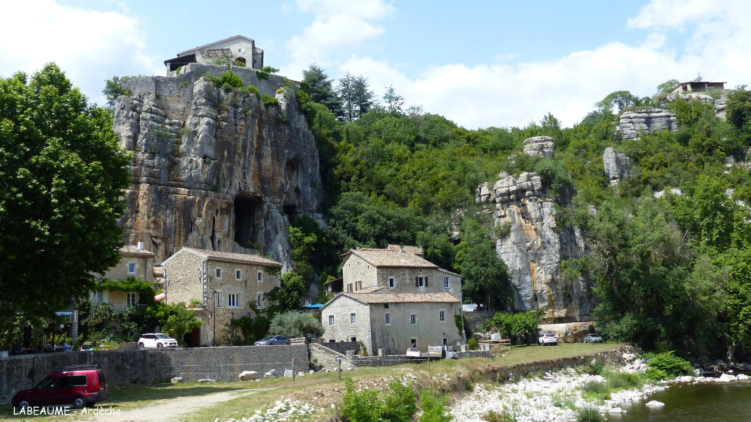
LABEAUME - Ardèche