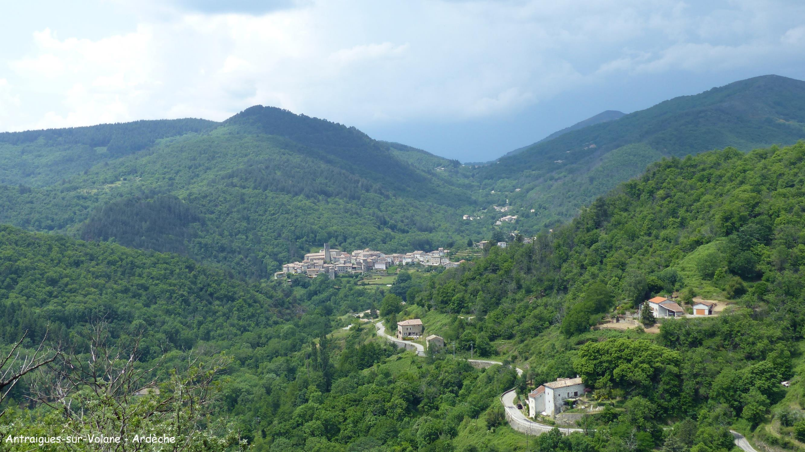
Antraigues-sur-Volane - Ardèche