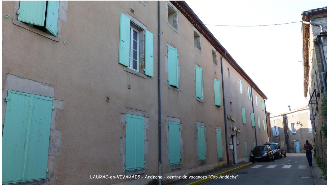
LAURAC-en-VIVARAIS - Ardèche - centre de vacances "Cap Ardèche"