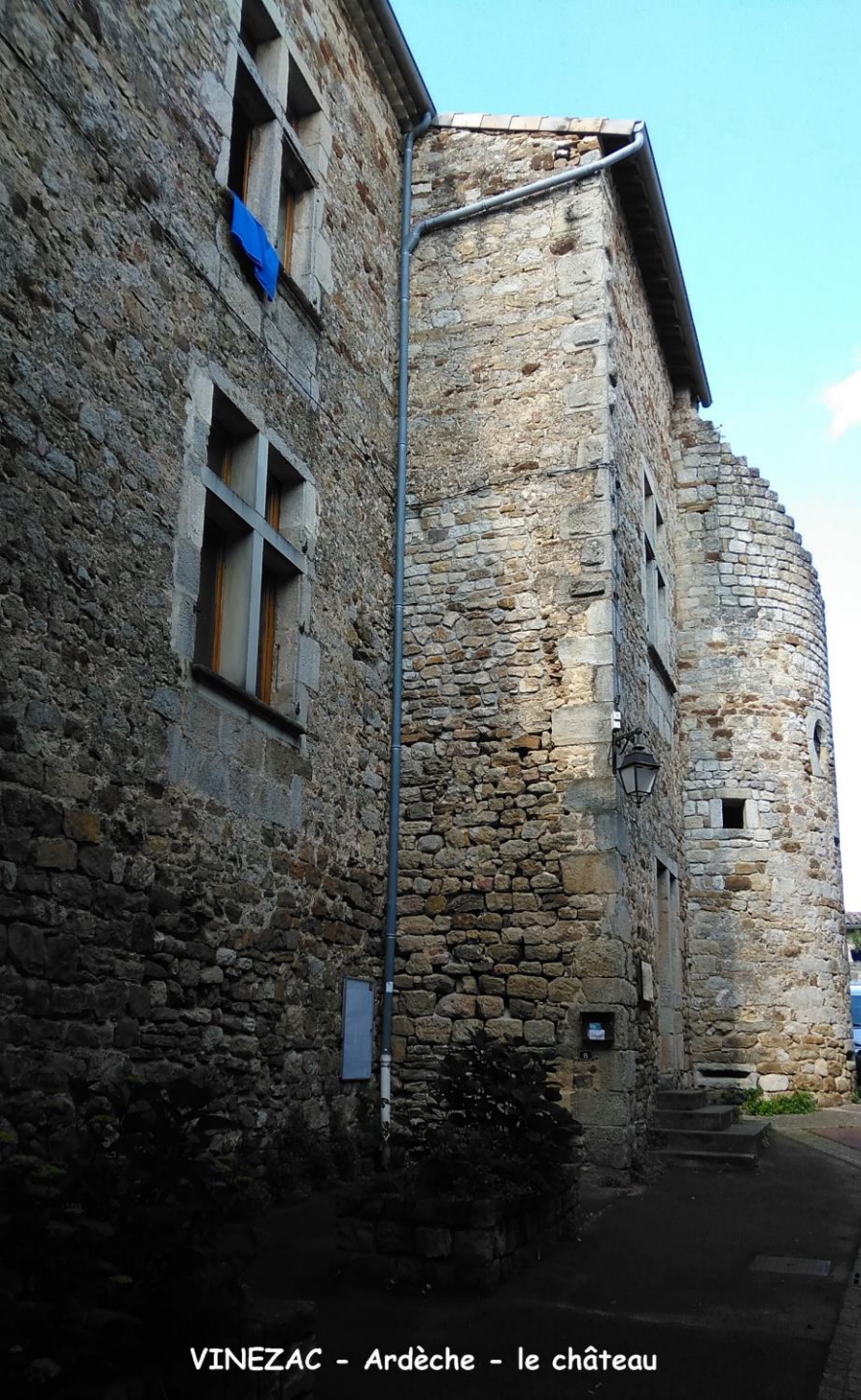
VINEZAC - Ardèche - le château