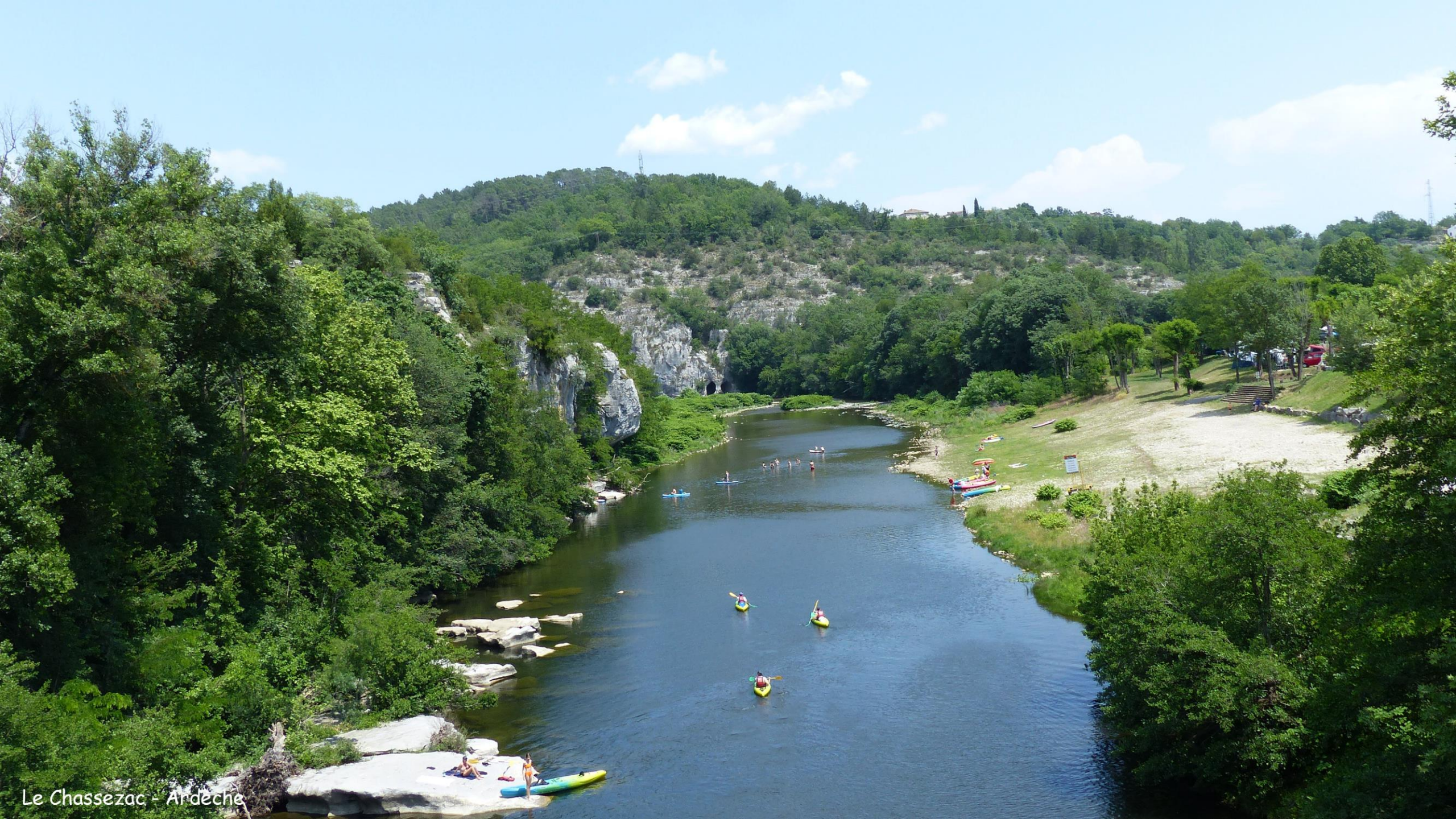
Le Chassezac - Ardeche