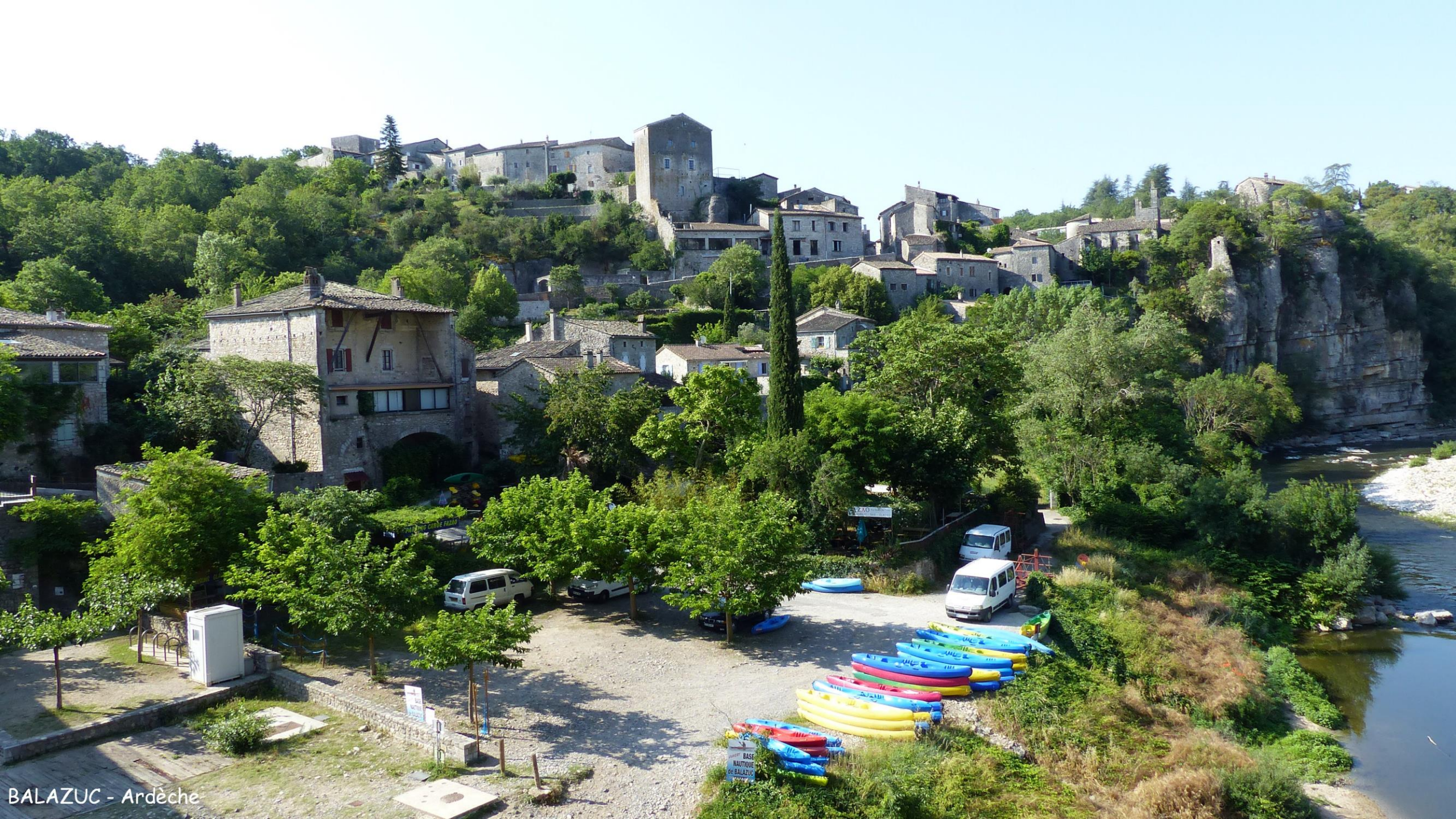
BALAZUC - Ardèche