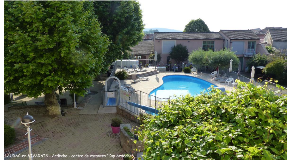
LAURAC-en-VIVARAIS - Ardèche - centre de vacances "Cap Ardèche"