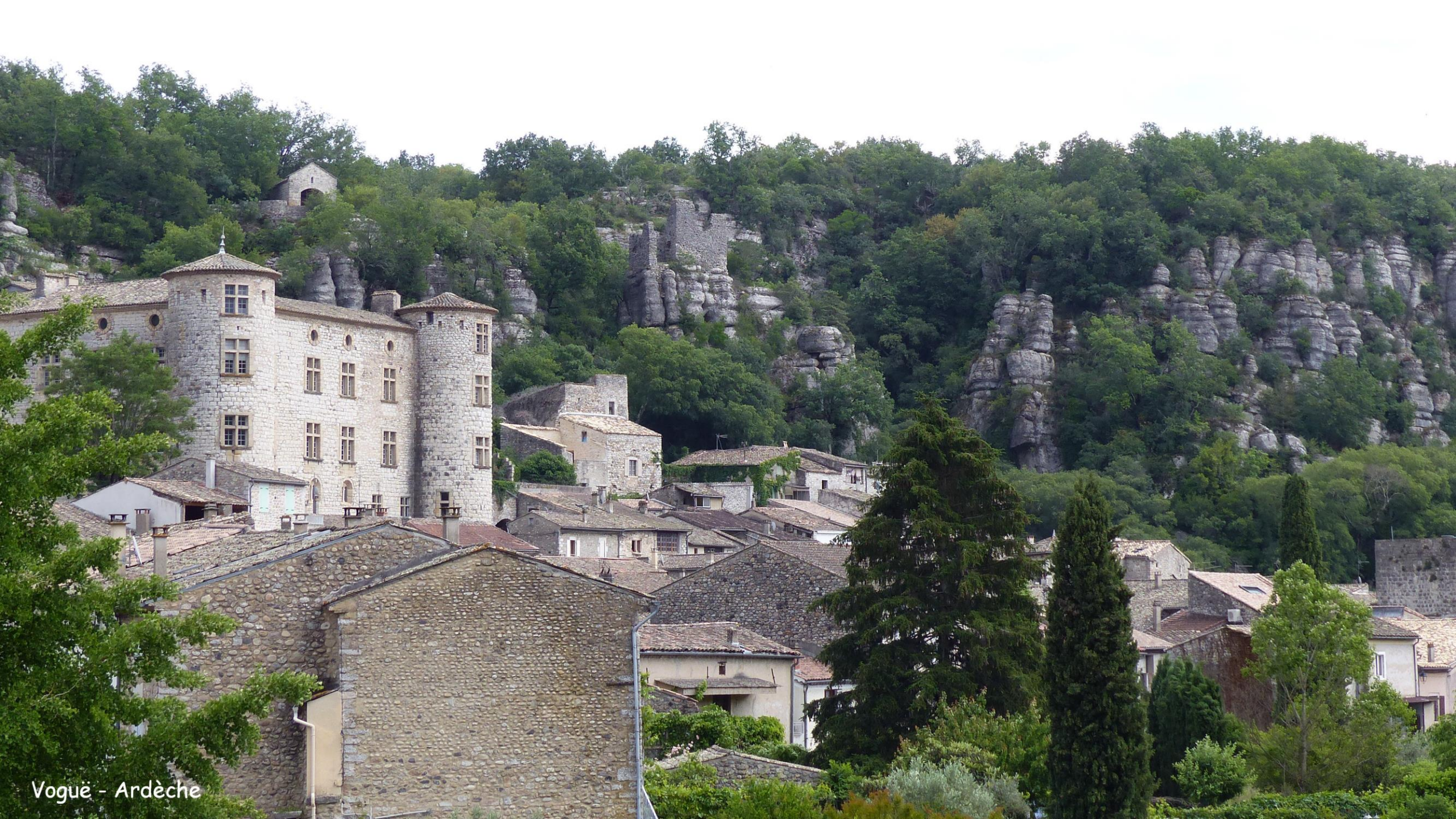
Vogüé - Ardèche