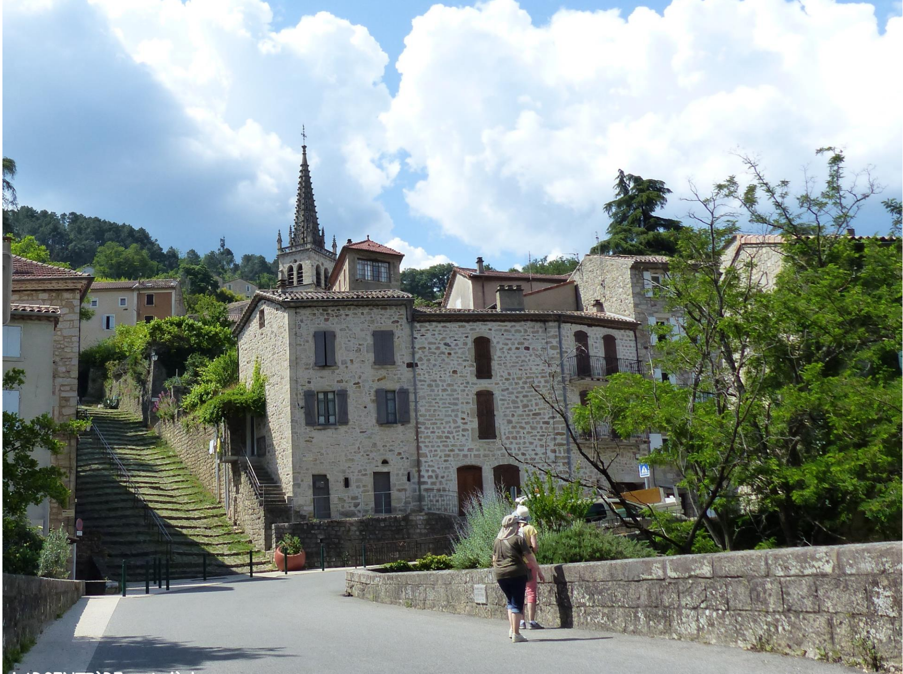
LARGENTIÈRE - Ardèche