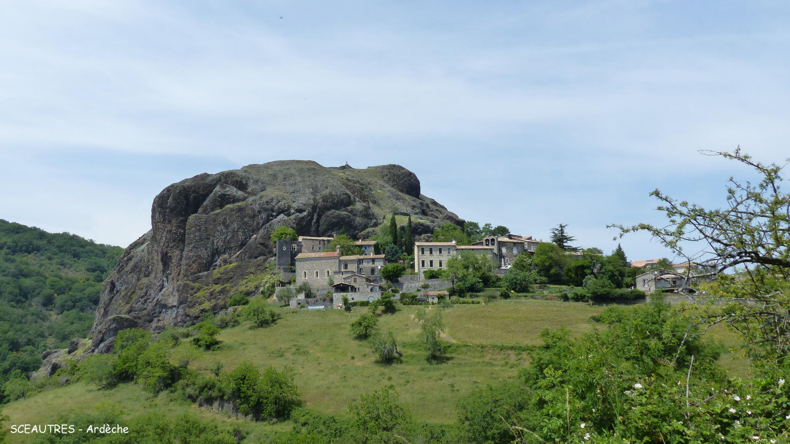
SCEAUTRES - Ardèche