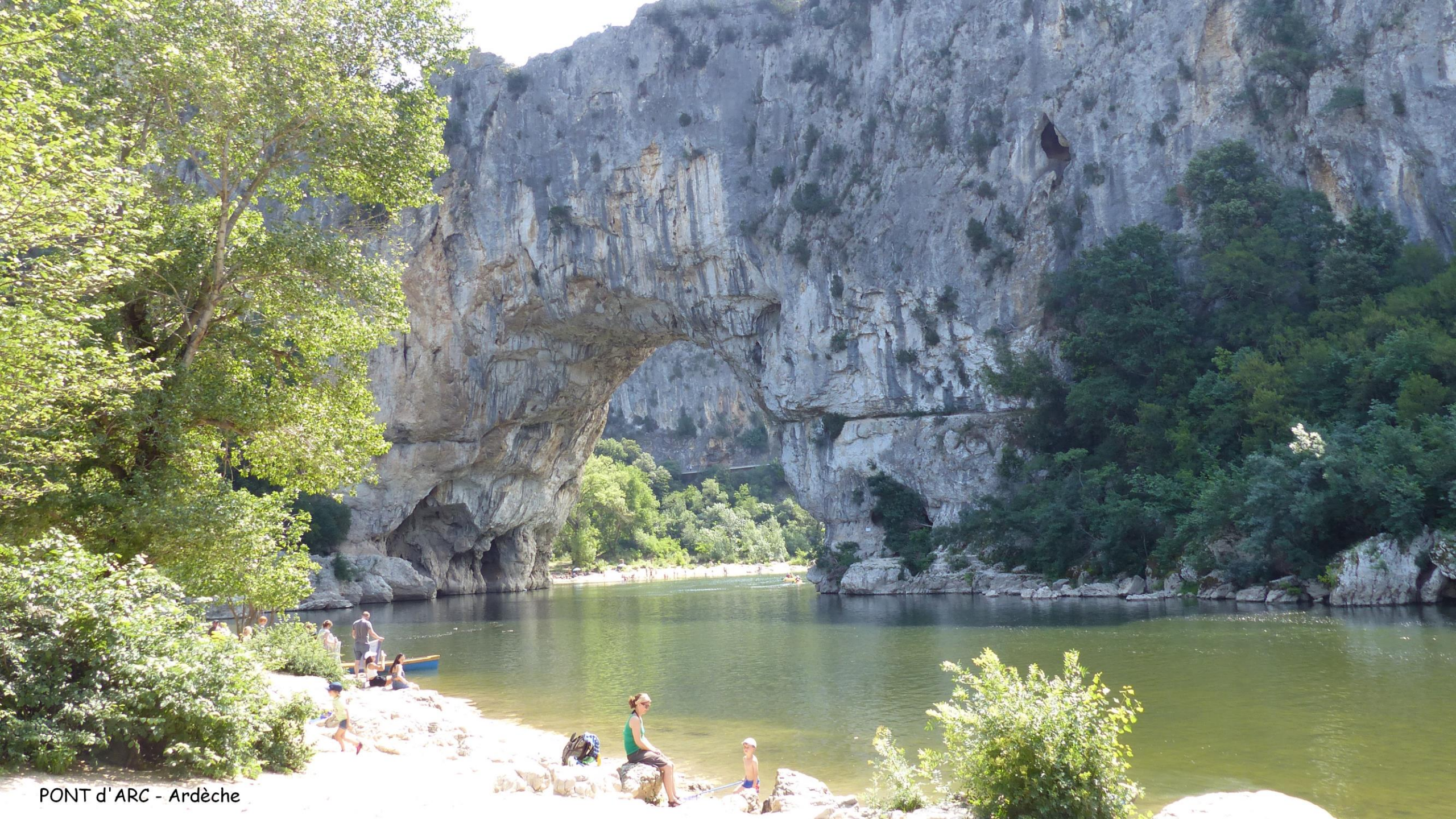
PONT d'ARC - Ardèche