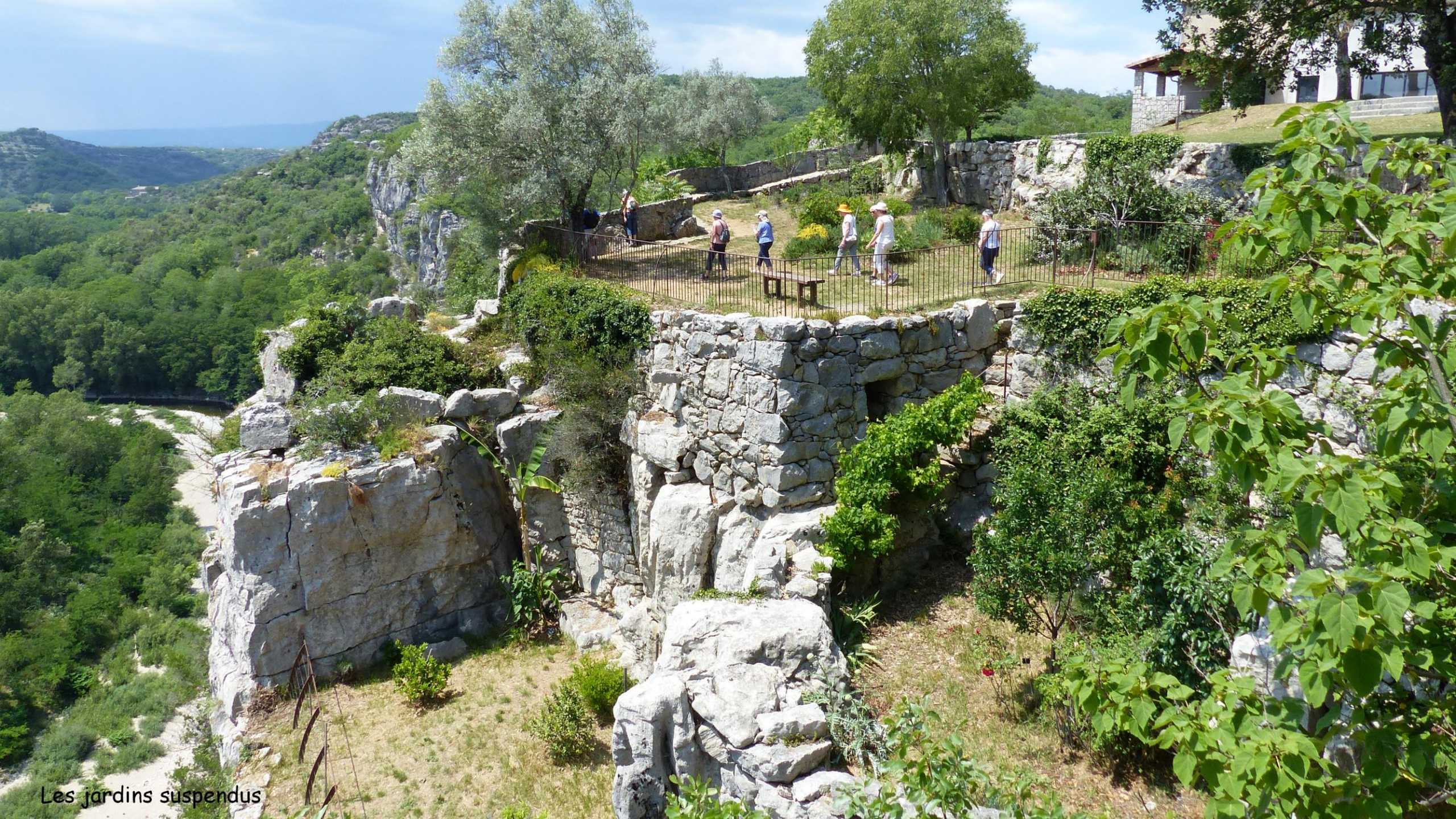
Les jardins suspendus