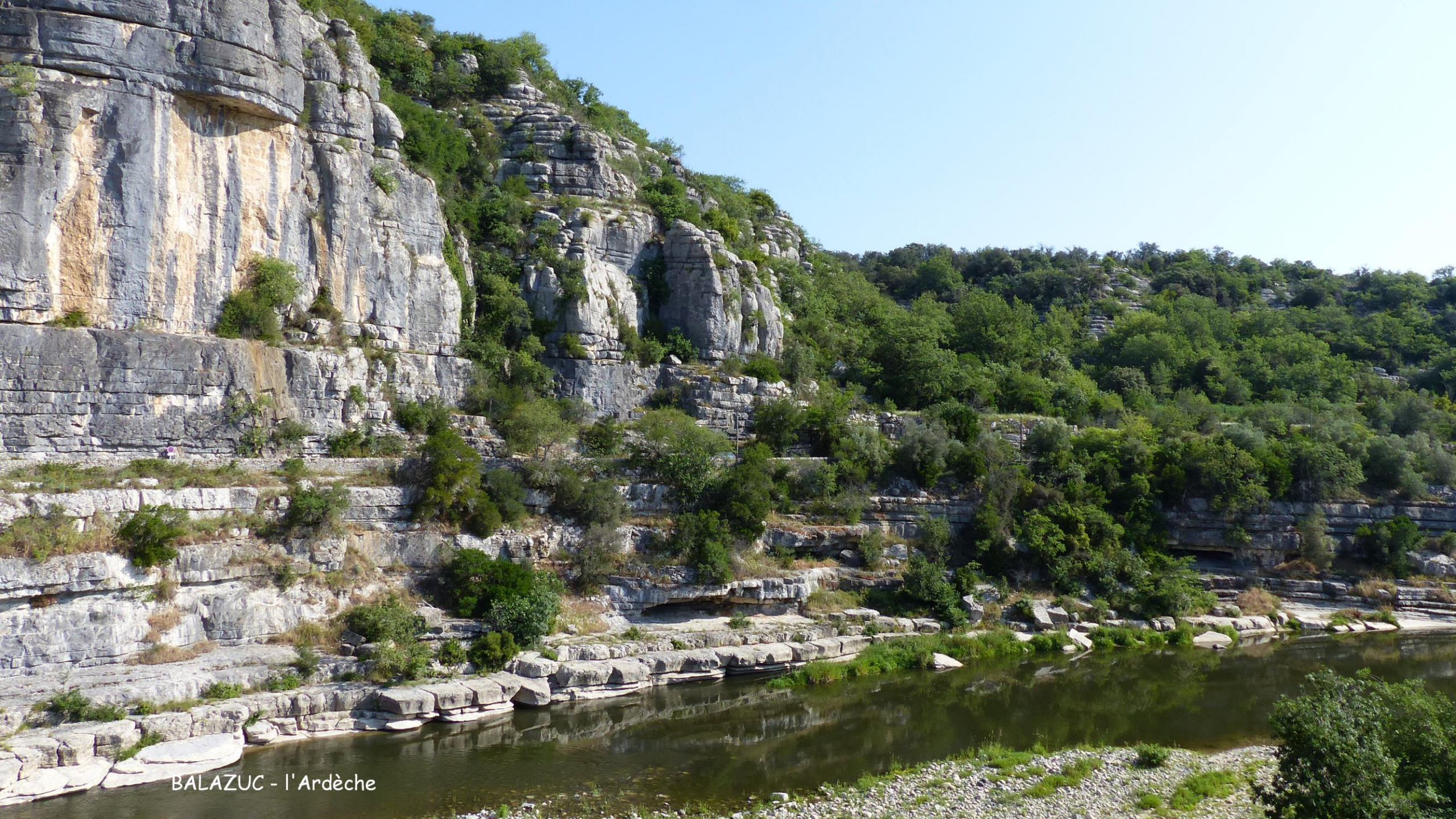
BALAZUC - l'Ardèche