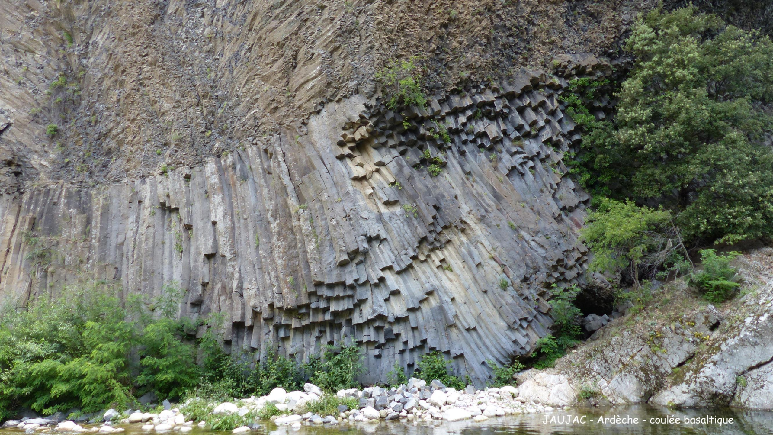
JAUJAC - Ardèche - coulée basaltique