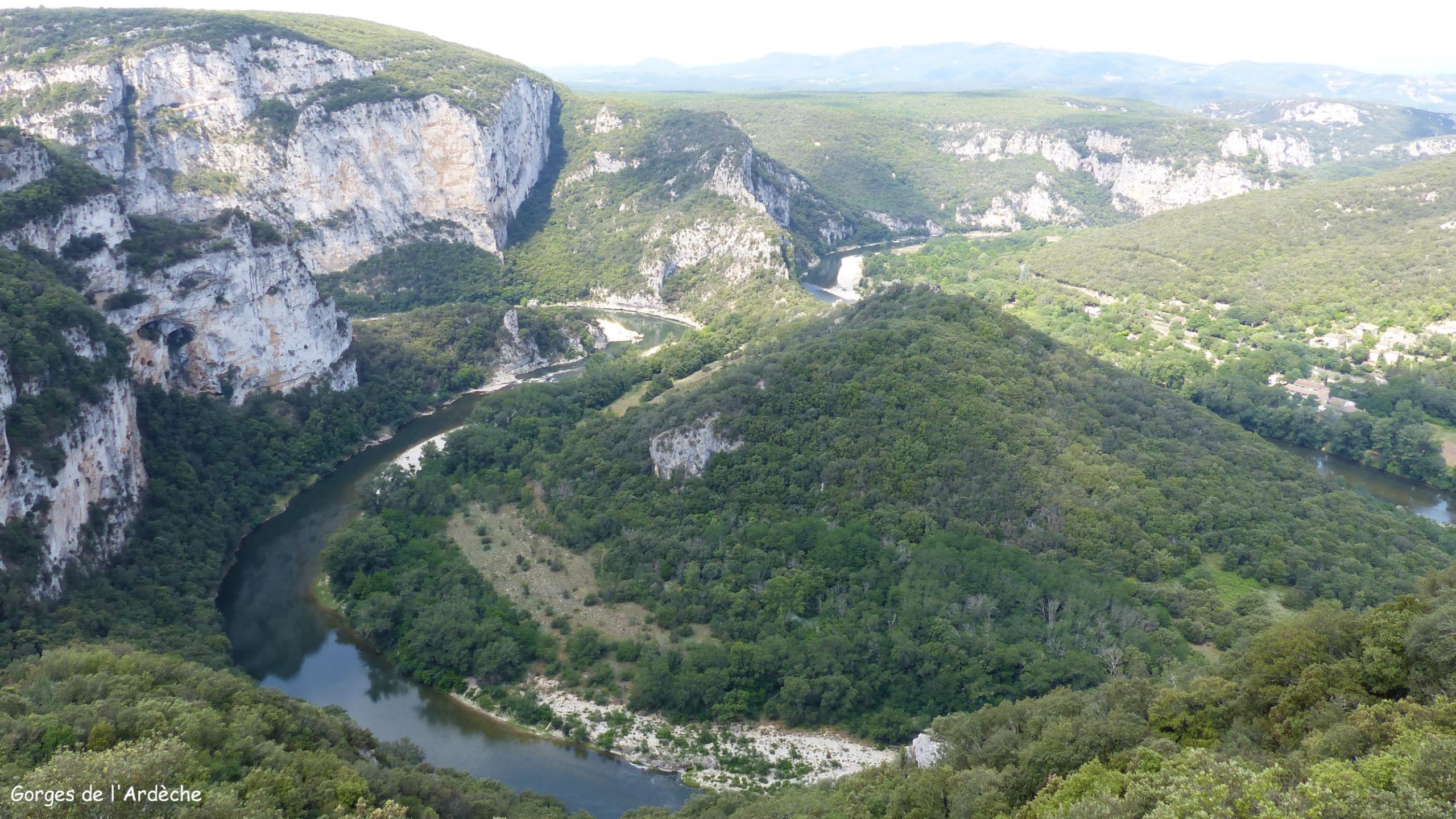
Gorges de l'Ardèche