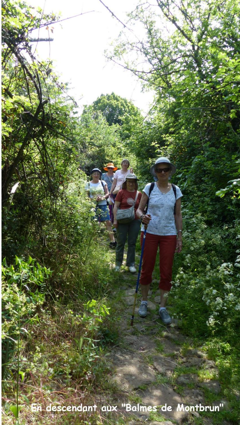
En descendant aux "Balms de Montbrun"