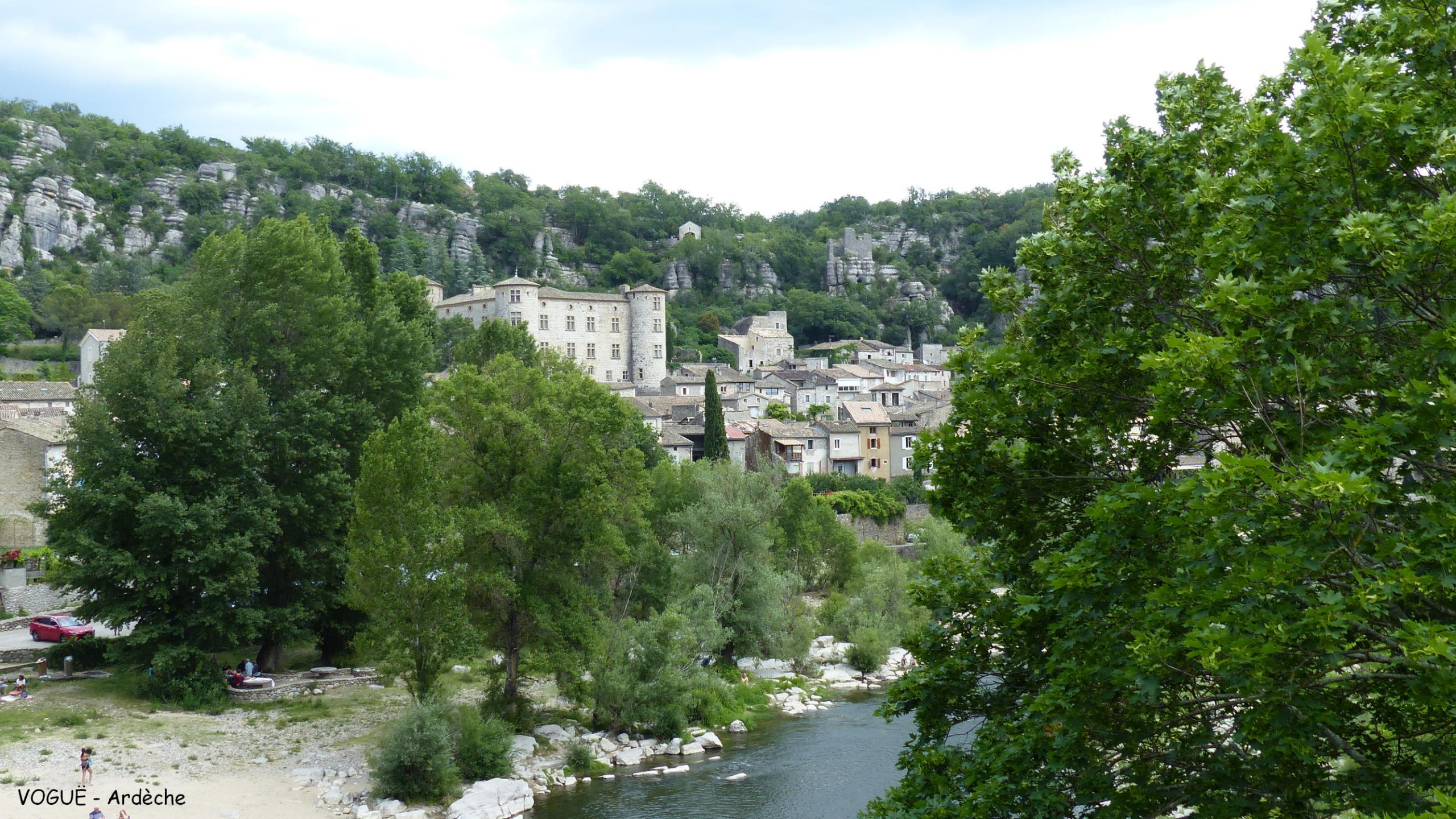
VOGÜÉ - Ardèche