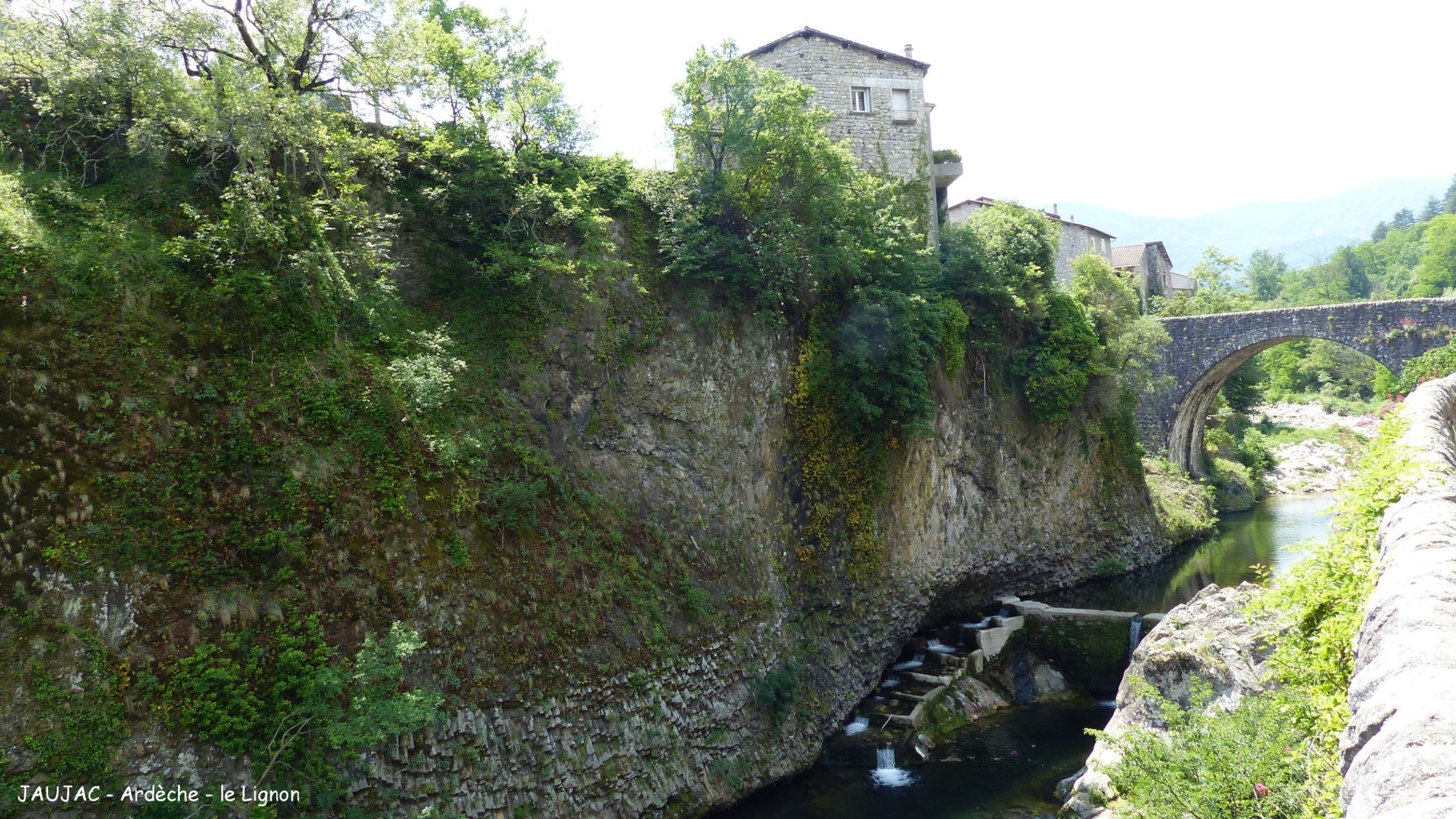
JAUJAC - Ardèche - le Lignon