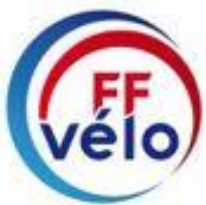
FÉDÉRATION FRANÇAISE DE CYCLOTOURISME

La recherche d'informations sur Internet est devenue un réflexe inné pour beaucoup de personnes. Aussi, avec un site Internet un club permet à ses potentiels adhérents ou à ses membres actuels de suivre son ACTUALITÉ , de connaître et de PARTAGER ses ACTIVITÉS , de présenter les bénévoles du Comité d'administration, les membres du bureau, les statuts et le règlement intérieur de l'association, et aussi par l'affichage de " LIENS ", de se connecter sur d'autres sites ou outils concernant la pratique du cyclotourisme.