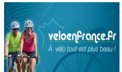
Un grand choix de parcours...

(Cliquer sur les icones pour vous connectez aux sites correspondants)